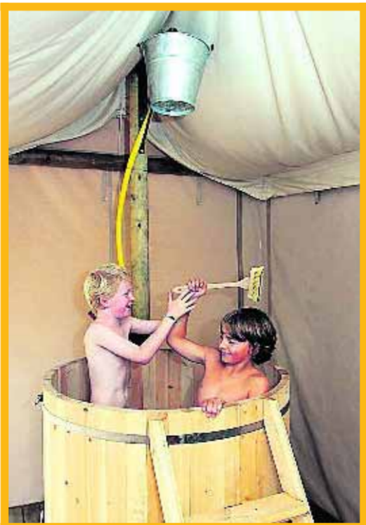
■ Douchen in de tobbe, pret verzekerd.

Want dat is de bedoeling van het Verborgen Verblijf. Je leert ontdekken, je zintuigen prikkelen, ontwaasten en daar ook de tijd voor nemen. Dat de ontdekkingsreiziger niet licht bepakt en bezakt op zijn missie ging, is duidelijk. Hij nam de 'duivel en z'n ouwe moer' mee. Onze jongens zullen zich niet vervelen. En al snel wordt duidelijk dat je ook als ouder de handen uit de mouwen moet steken. Het verblijf is namelijk volledig CO2-neutraal. Voor de oliëkachel wordt biodiesel gebruikt als brandstof, koken doe je op hout in de aparte kookwagen en heet water krijg je door het met hout te verwarmen. Wil je onder de douche of in bad, dan betekent dat TIJD! 'Haast' moet je thuislaten, terug in de tijd betekent 'geduld'. Hier ben je vooral bezig met de basiszaken van het