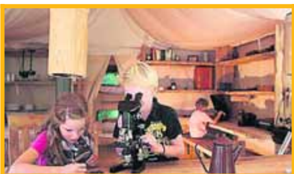
■ Uilenballen pluizen en door de microscoop naar het resultaat staren.