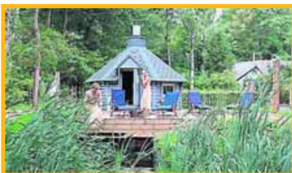
■ De sauna ligt net zo verholven als de tent.