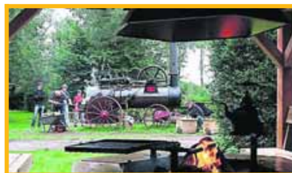
■ Eén keer per week wordt de stoommachine in werking gezet om de accu's mee op te laden.