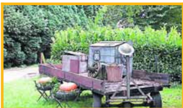
■ Bij binnenkomst kom je gelijk in de stemming van de tijd van de ontdekkingsreiziger.