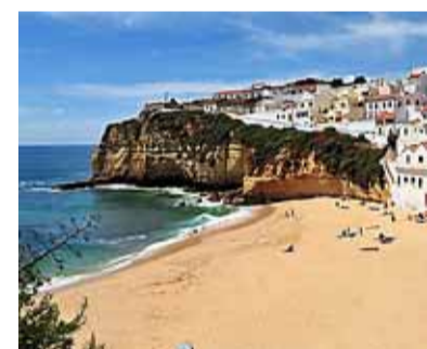
Carvoeiro beach, Algarve, Portugal

Kans maken op deze prijs? Ga naar www.reiskrantreporter.nl en schrijf een Reiskrant Report over een eerdere vakantie of stedentrip. Het is hierbij belangrijk dat je relevante tips geeft en anderen kunt inspireren! Vink aan dat je als Reiskrant Reporter naar Sint-Maarten wilt en je maakt automatisch kans op die geweldige ervaring. Je hebt tot en met zondag 12 mei om een report te schrijven. Daarna maken we de winnaar bekend. Succes!