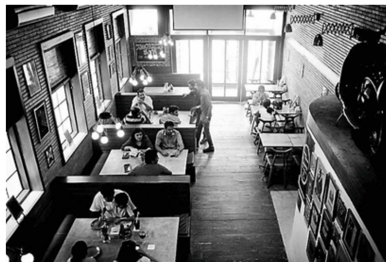
De Monkey Bar in Bangalore, India