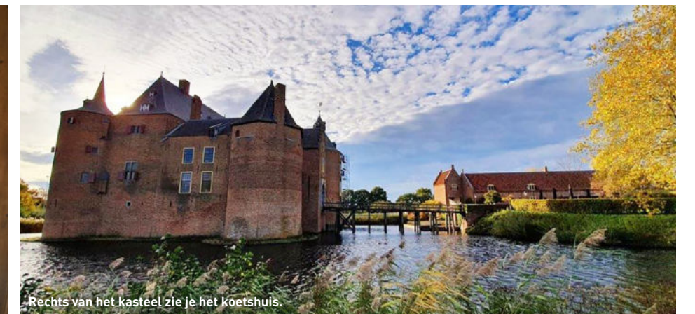
Rechts van het kasteel zie je het koetshuis.